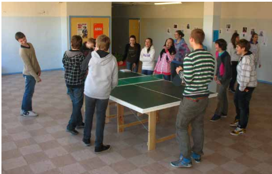
7.c klass lõbutsemas pinksilaua ümber.

Veerandilõpus ilmus II korruse fuajeesse pingpongilaud, mille III kooliastme poisid ise valmistasid. Laud on saavutanud ülima populaaruse, selle ümber on rahvas varahommikust hilisõhtuni, nii vahetunnis kui tundide ajal. Probleem on selles, et reketeid pole veel valmistatud ning palli löömiseks kasutatakse kõike, mis kätte juhtub, kõige sagedamini koolipäevikuid.