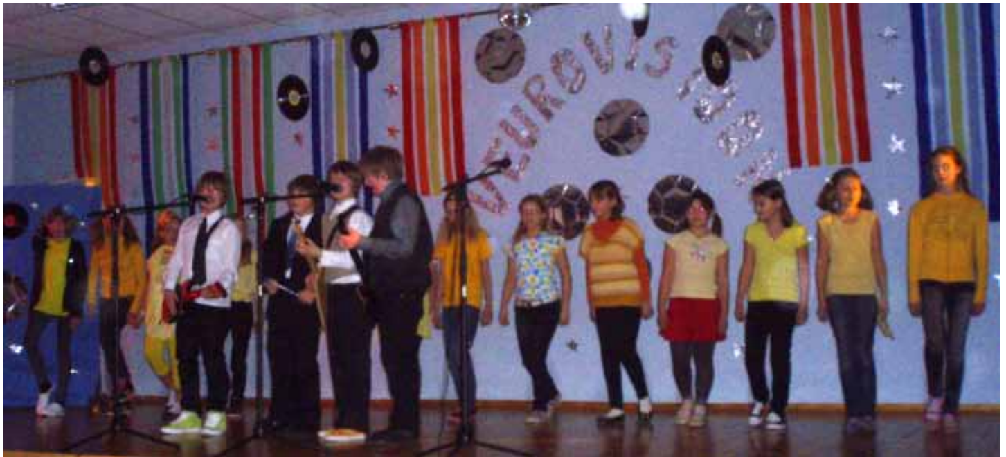
60ndate kütkes olev 4.a klass.

2. märtsil toimus Veeriku kooli lauluvõistlus Veurovisioon. Veurovisiooni korraldamine ei laabunud just kõige paremini, sest üritus tuli külmapühade tõttu edasi lükata.