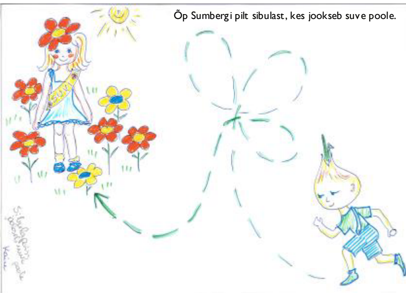
Õp Sumbergi pilt sibulast, kes jookseb suve poole.