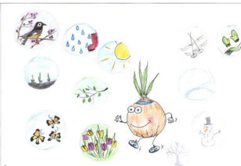
Õp Toome sibul jooksmas suve poole.

Kui te poleks õpetaja, mis amet teil siis oleks? Töötaksin loomade varjupaigas või peaksin lambaid alpakasid või õmbleksin, teeksin käsitööd või oleksin lihtsalt ilus.