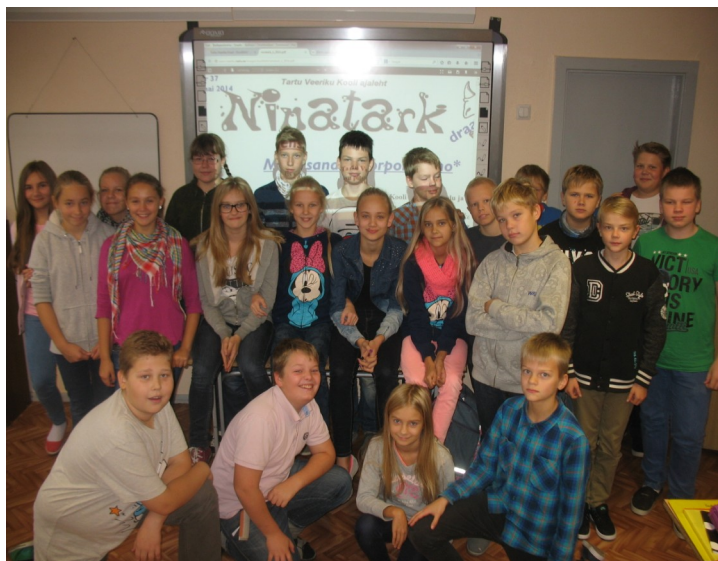
Tublid ajakirjanikud 6. klassist.

Selle koolilehe koostasime meie, kuuendikud. Tegime palju intervjuusid, suhtlesime õpetajate ja koolikaaslastega, viisime läbi küsitlusi, proovisime kätt reportaaži ja arvustusega. Selgus, et ajalehe tegemine polegi nii lihtne, sest intervjuueeritavatega ühise aja leidmine osutus väga keeruliseks, mõned artiklid ei saanudki valmis, sest asjad läksid meelest ära ja nimed olid keerulised. Kokkuvõttes oli ajalehte päris raske valmistada, kuid selle käigus õppisime artikleid koostama, õppisime tundma oma kooli rahvast ja saime aru, et ajaplaneerimine on ääretult tähtis.