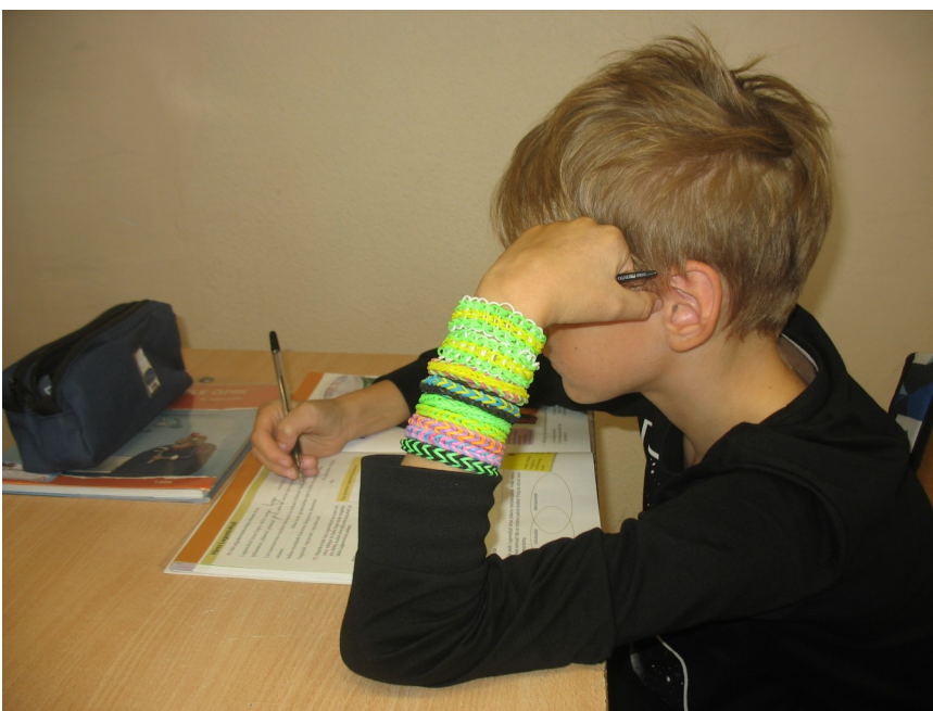
Loom bands 'ide fänn 4. klassist.